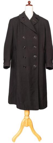
圖片說明：安東尼·聖修伯里的軍事外套