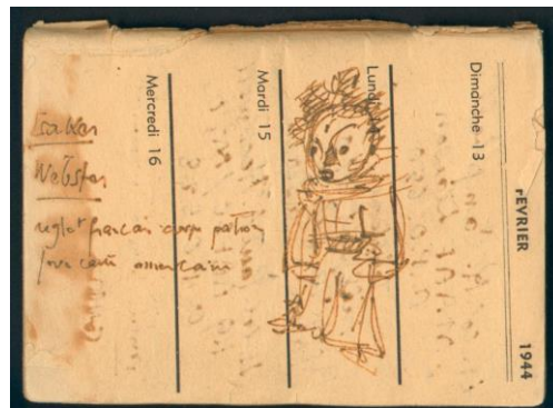
圖片說明：小王子草圖