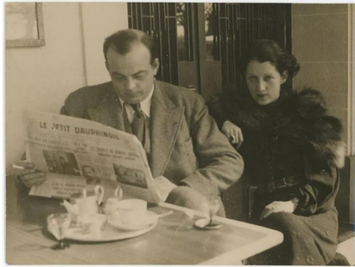
圖片說明：安東尼·聖修伯里與妻子康蘇艾蘿於參觀航空展時留影