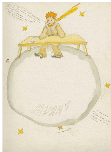
圖片說明：小王子坐在星球上，圍巾隨風飄揚，桌前用餐

同時，現場更特別展出八尊香港獨家一比一《小王子》彩色雕塑，並同步開放預購，讓收藏家和愛好者紀念聖修伯里這部享譽全球的經典著作。